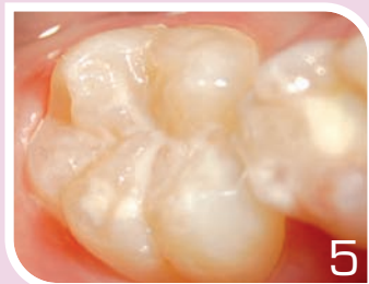
Laisser agir 15s