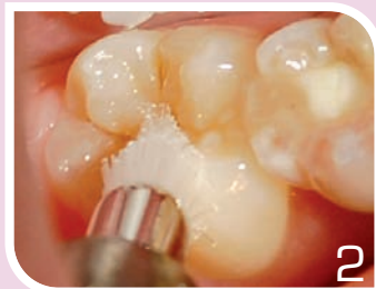
Nettoyer sous spray d'eau