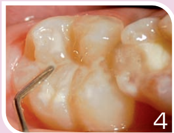
Appliquer le Prevent Seal