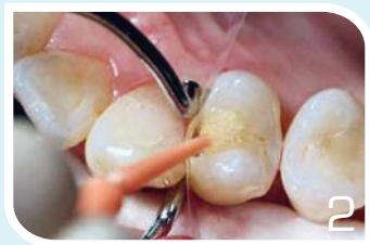
Application d'un adhésif (Iperbond)