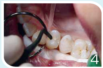
Stratification du Perfect Feel par couches successives de 2mm